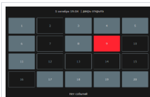
Приложение Мониторинг. Стартовое окно

Время выполнения операций с ключами ограничивается. По истечении все ключи блокируются, сигнализируется удержание двери. Таким образом система защищена от невнимательности пользователя. Все текущие состояния ячеек, ФИО последнего владельца с фотографией, а также сведения о тревожных событиях предоставляются в приложении мониторинга.