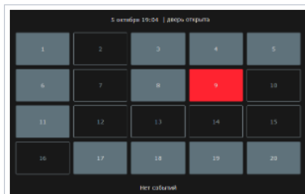
Приложение Мониторинг. Стартовое окно

Время выполнения операций с ключами ограничивается. По истечении все ключи блокируются, сигнализируется удержание двери. Таким образом система защищена от невнимательности пользователя. Все текущие состояния ячеек, ФИО последнего владельца с фотографией, а также сведения о тревожных событиях предоставляются в приложении мониторинга.