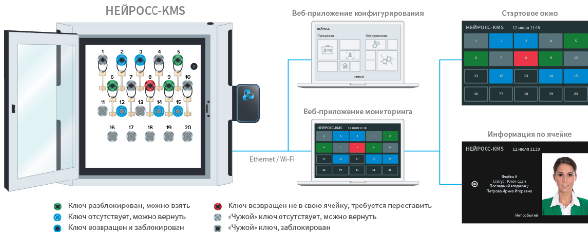
Схема изделия и режимы индикации