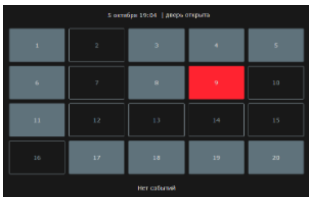
Приложение Мониторинг. Стартовое окно